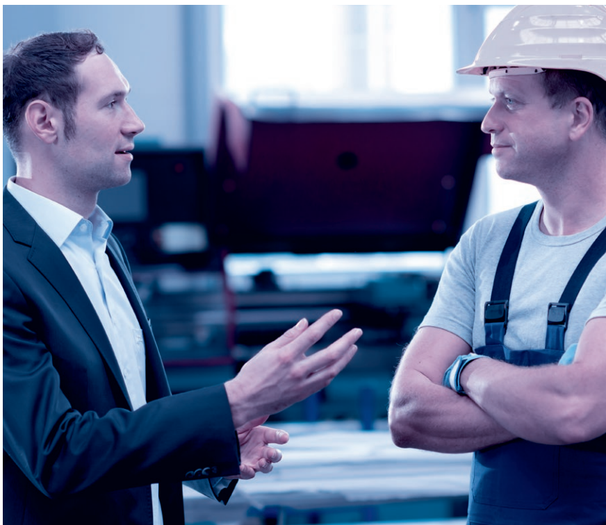
Das Mitarbeitergespräch ist keine Nebensache. Nehmen Sie sich Zeit und hören Sie zu.

Sinnvollerweise wird für das Mitarbeitergespräch zudem ein über die Jahre gleichbleibender Beurteilungsbogen mit einer Bewertungsskala (mit Smileys, Ampeln, Zahlen oder Buchstaben) verwendet.